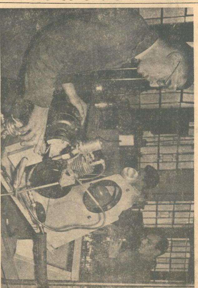
RS-fabricage. Proeftaarten RS-motor.